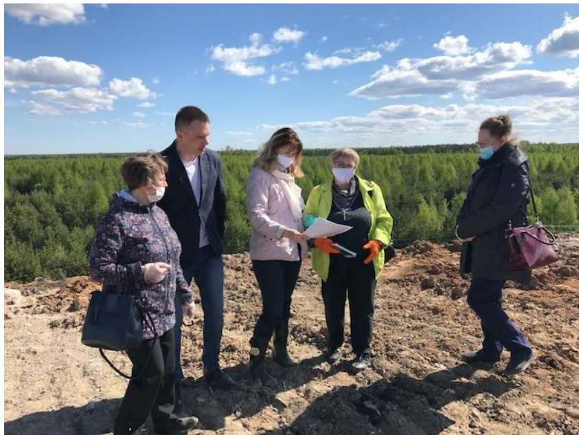
«Реконструкция /рекультивация полигона ТКО в д. Орел Лаишевского района РТ»