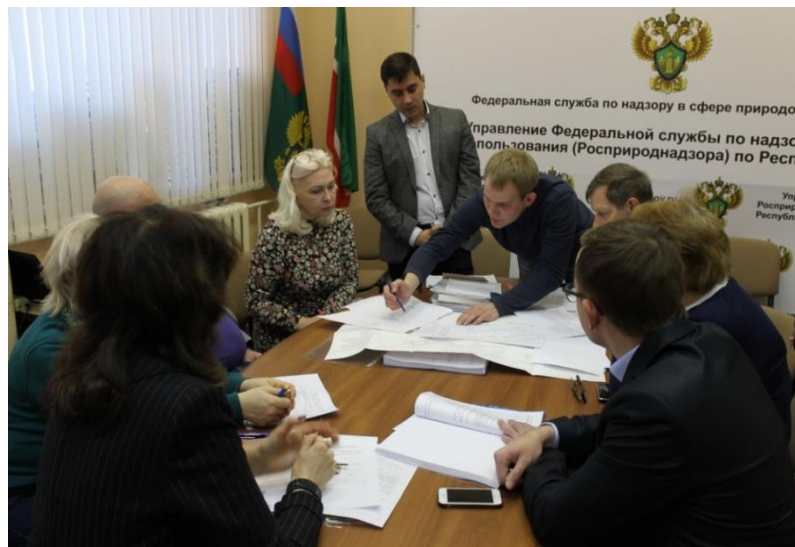
«Рекультивация свалки г. Мензелинска»