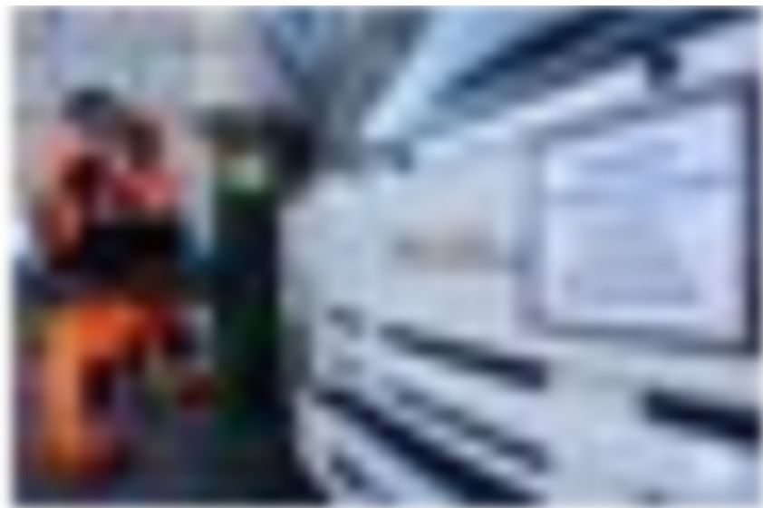
На 4% подорожают «мусорные» тарифы.