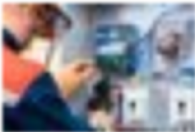
Программа установки интеллектуальных приборов учета «Татэнергосбыта» в прошлом году «разпухла» в 2,5 раза.

— Они всегда бьются за то, чтобы она сохранялась в тарифе. Более того, в тарифе «Татэнергосбыта» заложено два вида прибыли: есть расчетная предпринимательская прибыль и инвестиционная составляющая, которая тратится на обновление счетчиков. Разумеется, это естественное желание компаний — сохранить в тарифе инвестиционную составляющую. До сих пор было так, что не все инвестиционные затраты попадали в тариф. Но в этом году работа привела к тому, что в тариф попало все, поэтому и процент такой, — пояснил он.