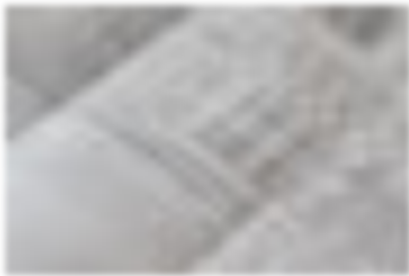
Татарстан обогнал остальные российские регионы по ежегодному росту тарифов ЖКХ.

Сдерживать аппетиты ресурсоснабжающих компаний должен механизм ограничения предельного роста платы, который призван сбалансировать интересы потребителей и производителей, «вычищая» из тарифа необоснованные инвестиционные траты. Последнее слово в регулировании остается за ФАС РФ, которая принимает итоговое решение по установлению предельного индекса на основе анализа поступивших документов с обоснованием необходимости реализации инвестиционных программ. По окончании года отчет о реализации инвестпрограммы направляется регулятору за подписью высшего должностного лица субъекта федерации.