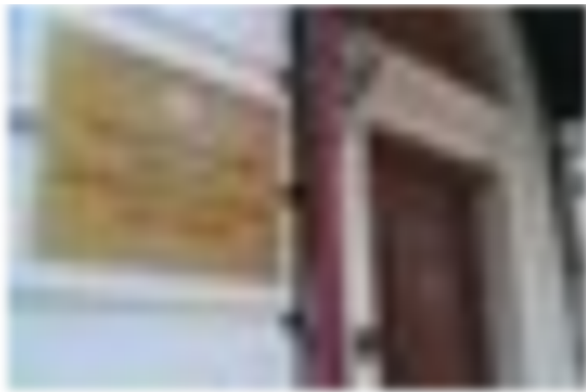
Госкомитет по тарифам решил в тарифах на 2022 год компенсировать порядка 1,5 млрд рублей расходов ранее не учтенных в тарифе, заметил Тимур Халиков.

Нельзя ли укротить аппетиты региональных монополистов. По мнению Тимура Халикова, поставщики подчас шантажируют уполномоченные республиканские ведомства, мешая действовать более решительно.