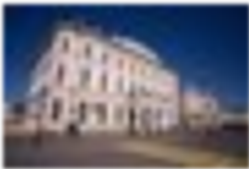
По данным городских чиновников, перед изменением тарифов был проведен подробный анализ ситуации.

— Привлеченные за счет увеличения тарифов средства будут иметь строго целевой характер и позволят ежегодно реконструировать наиболее изношенные сети «Водоканала». Сегодня предприятие обслуживает 3 тысячи км сетей, из которых 70% ветхие и аварийные, срок их эксплуатации истек 10 и более лет назад. Эти сети были проложены в 50—70-х годах прошлого века, запас их прочности давно исчерпан. За последние 10 лет выявлено и принято на баланс «Водоканала» более 1 300 км бесхозных сетей с износом более 90%. За период с 2010 года на сетях водоснабжения города по причине износа произошло более 14 тысяч аварийных ситуаций, — заявили в исполкоме.