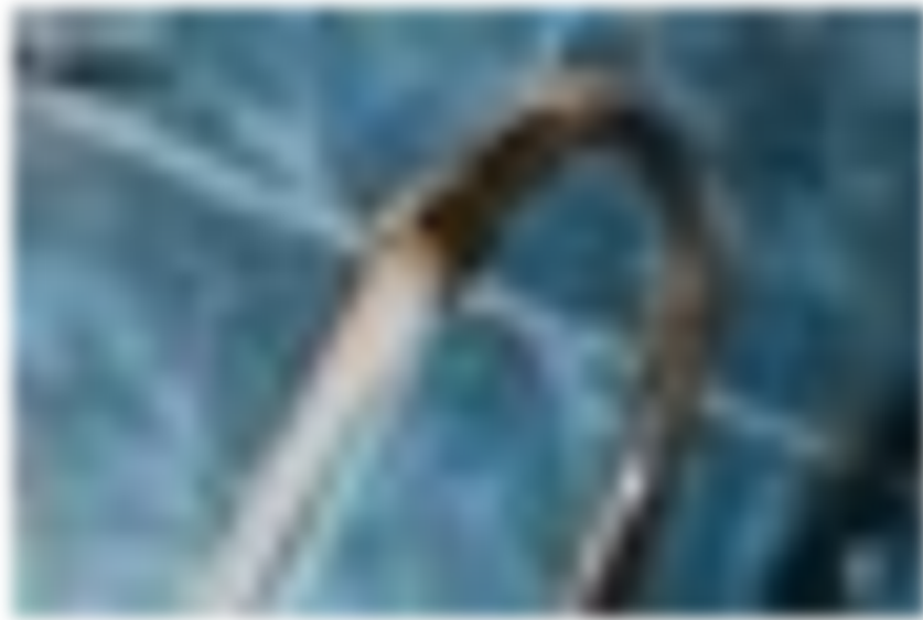
Средний тариф на питьевую воду в РТ с 1 июля составит 28,7 руб./куб. м.

Водные ресурсы в столице становятся дороже, постепенно приближаясь к уровню городов федерального значения. Средний тариф на питьевую воду в Татарстане с 1 июля составит 28,7 руб./куб. м. В Казани, Набережных Челнах и Зеленодольске она подорожала в среднем чуть выше 10%, прибавив 2 рубля за куб. Если быть точнее, то в Казани рост составил 10,9%, или на 2,43 рубля из-за инвестпрограммы МУП «Водоканал», в Набережных Челнах повышение составит 2,8%, или на 68 копеек, а в Зеленодольске на 1,32 рубля (поставщику ЗВКС проиндексировали тариф на 6%).