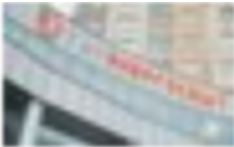
В «Татэнергосбыте» отметили, что показатель среднего роста тарифов на услуги ЖКХ для населения — это совокупное изменение ряда тарифов.

Таким образом, рост конечного тарифа на электроэнергию для населения с 01.07.2022 (4,6%) ниже максимального уровня, установленного государством (5%), и в пределах увеличения в среднем по стране, заявили в «Татэнергосбыте».